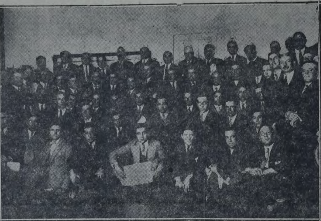
DELEGADOS DE LA PROVINCIA DE BUENOS AIRES